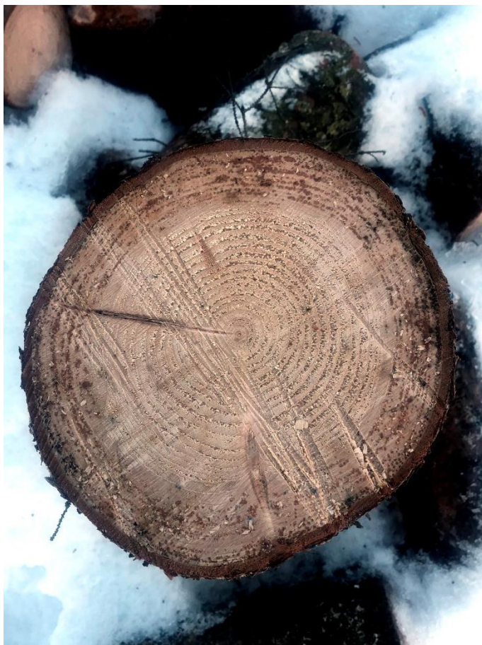
Bilde nr 1