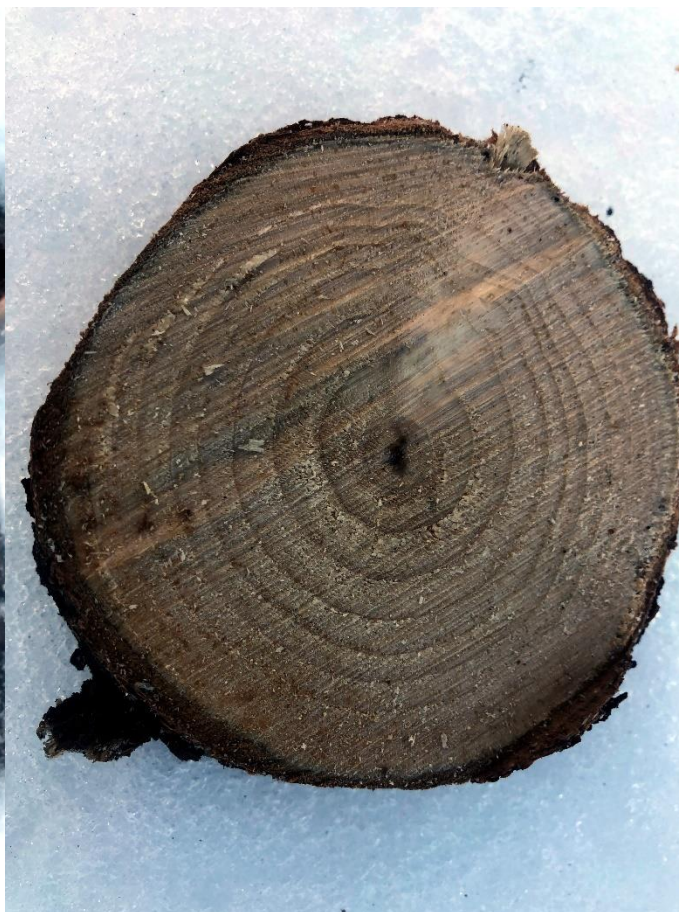
Bilde nr 2

Fra det samme treet har vi laget en stammeskive som er skjært ut litt lenger oppe på stammen. Se bilde 2. Tell årringene på stammeskiven også.